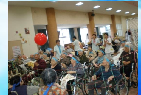
風船バレーの様子