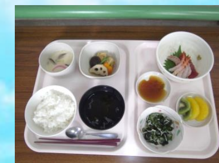
管理栄養士による食事管理